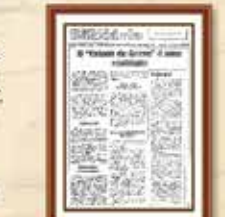
Fórum Nova Luta Brasileira em plena greve - 1985