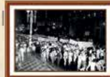
Paralisação dos empregados da Caixa reivindicando a jornada de 6 horas e o direito à sindicalização - 1985