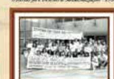
Empregados da Caixa demitidos na greve de 1991 e reintegrados ao banco em 1992