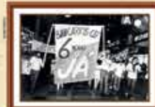
Paralisação dos empregados da Caixa reivindicando a jornada de 6 horas e o direito à sindicalização - 1985