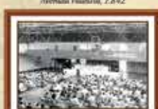
Comitê Salarial de 1991 - Avenida Paulista, 2.862