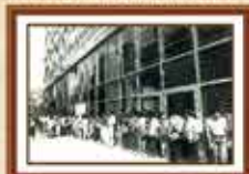
Constituição de escritório interno em frente da agência Avenida Paulista - 1985