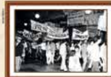
Paralisação dos empregados da Caixa reivindicando a jornada de 6 horas e o direito à sindicalização - 1985