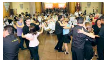
No sentido horário, comemoração do Dia do Aposentado organizada pela APCEF/SP em 2012, 2013, 2010, 2011 e 2015