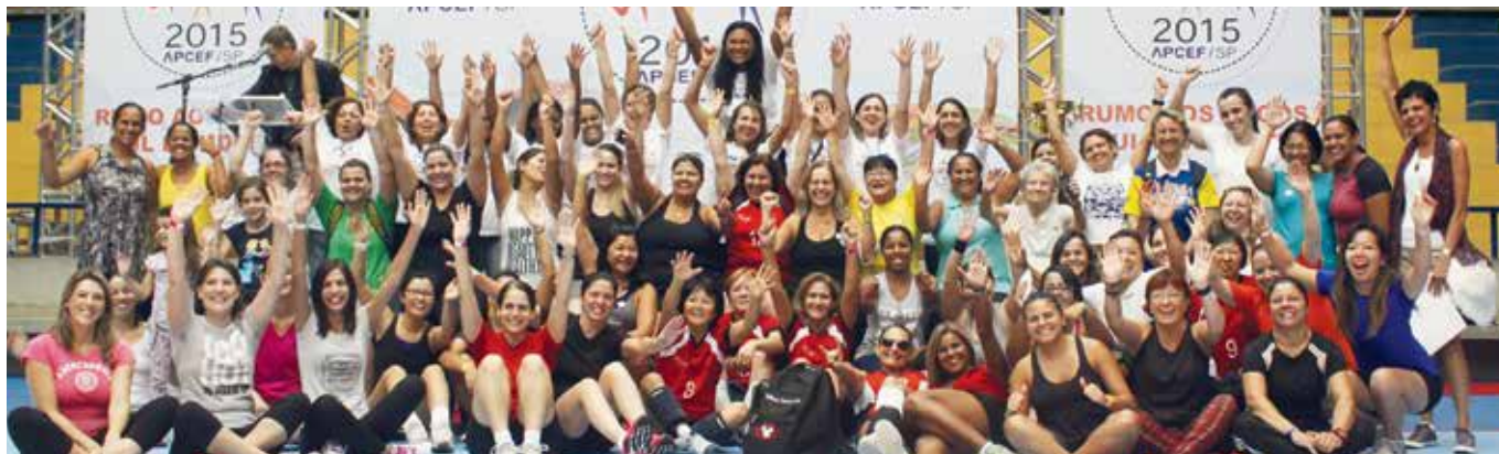
Comemoração do Dia da Mulher durante os Jogos de Integração de 2015

É hora de reunir os amigos, escolher a modalidade que mais gosta de praticar e intensificar os treinos para fazer bonito na edição de 2016 dos Jogos da Fenaef. A competição nacional acontece entre 20 e 27 de agosto, em Blumenau, Santa Catarina.