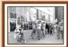
Comitê de Negociação em 1989 no 5º Congresso