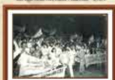
Constituição dos empregados da Caixa na estrutura do Teatro Municipal após paralisação sindicalizada a jornada de 6 horas e o direito à sindicalização - 1985