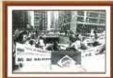
Paralisação de 1985 - Avenida Paulista (antiga sede da Caixa)