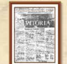
Atividade de contribuição ao processo de movimento dos empregados da Caixa iniciada em 1985