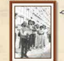
Demissão de 110 empregados, consequência do movimento grevista da campanha salarial