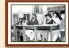
"Não toque em meus companheiros" - Dezembro de 1990